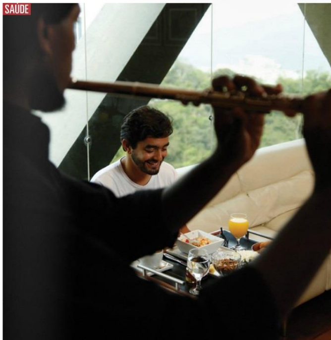
Pacientes são recebidos com café da manhã completo e música clássica ao vivo